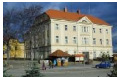
Rathaus, ehemalige Hauptverwaltung Fa. Dierig

Seit dem 16. Jahrhundert gewinnt dieses Gebiet durch die Entstehung der sog. Hausweberei in den Dörfern besondere Bedeutung. Die Züchner-Zünfte in den Städten Reichenbach und Schweidnitz suchten Hilfe gegen die nicht durch Abgaben belasteten Hausweber. Die „Freiweber“ in den Dörfern konnten preiswerter auf dem Markt agieren als die Zünfte der Städte. Es gelang nicht, diese Freiweber zum Eintritt in die städtischen Zünfte zu bewegen, auch Repressalien halfen nichts. Die Freiweber breiteten sich immer mehr aus, unterstützt durch die Grundherren auf den Dörfern. Die Spannungen führten zu Plünderungen,