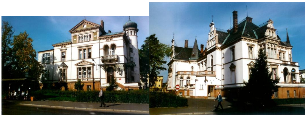
Dierig-Wohnhäuser um 1995, Dahinter, verdeckt die neue Hauptverwaltung.

Die Zeitzeugen, die zu dem Entstehungszeitpunkt des Dramas über das wahre, positive Verhältnis der Textilfamilie Dierig zu ihrer Arbeiterschaft hätten aussagen können, waren schon gestorben. So konnte sich eine Kollektivverurteilung aller Textilunternehmer ungehindert in der Weltliteratur ausbreiten, die sich nicht um Differenzierung kümmerte. Die sehr sozial eingestellten Unternehmerfamilie Dierig, die Kindergärten, Wohnungen, Betriebsrenten, Alterssicherung und andere soziale Errungenschaften erstmalig eingeführt hat, wurde damit für beklagenswerte Zustände mitverantwortlich gemacht, die sie nicht zu verantworten hatte. Wie der genaue Hergang des Aufstandes zeigt, begann er in Peterswaldau bei der Firma Zwanziger. Darüber wird berichtet: Am Morgen des 5. Juni 1844