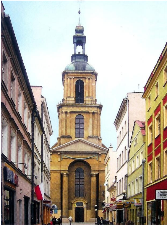
Carl-Gotthard Langhans Kirche