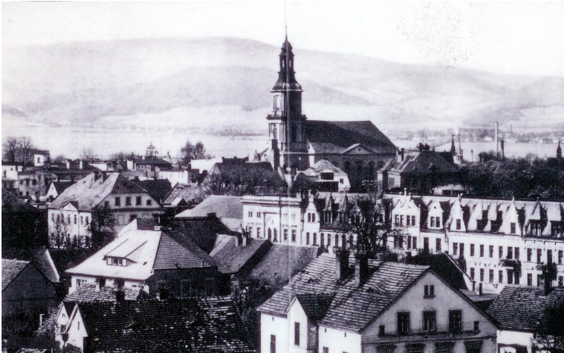
Totalansicht von Reichenbach und Eulengebirge im Hintergrund