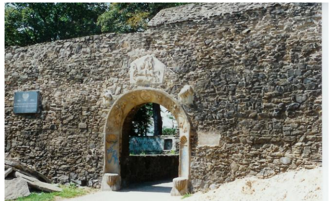
Stadtmauer mit Stadtwappen St. Georg 2005

Soweit der Auszug der Reichenbacher Chronik, der nur einige Höhepunkte in der Geschichte der Stadt, aber auch von ganz Schlesien, Deutschland und Europa beschreibt. Ich bin stolz auf diese Stadt, in der ich das Licht der Welt erblickt habe und auf die geschichtliche Tradition Schlesiens. Die Stadt und die Menschen haben Höhen und Tiefen erlebt. Die dunkelste Stunde begann mit der völkerrechtswidrigen Vertreibung aus der geliebten Heimat. Nachfolgende Generationen werden die Tragödie der Vertreibung einmal objektiver beurteilen. Schon heute sehen die Historiker – und auch die polnische Jugend – immer mehr ein, dass die Vertreibung der Deutschen aus ihrer angestammten Heimat, gegen zu dieser Zeit schon geltendes Völkerrecht geschah.