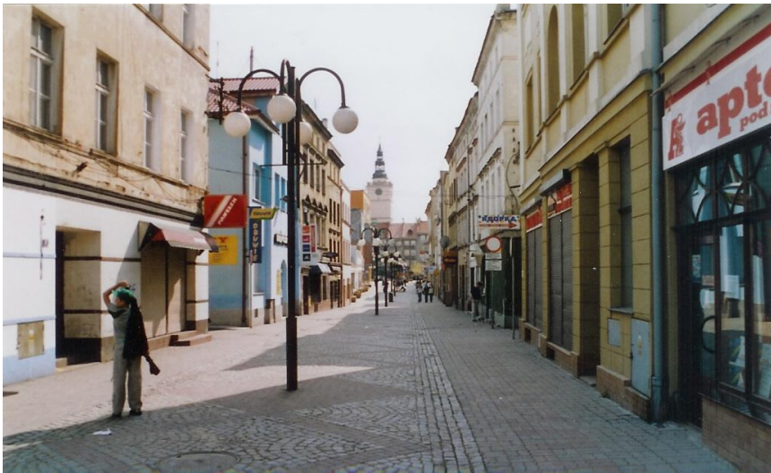
Breslauer-Straße im Jahre 2005