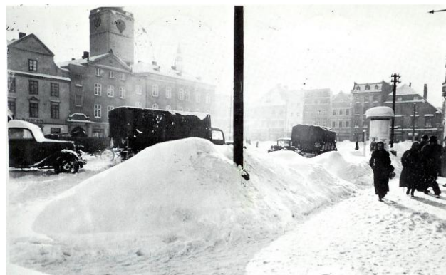
Ring vor 1945

Am 29.09.1859 konnte die katholische Gemeinde St. Georg ihre 700-Jahr-Jubelfeier begehen. 3000 Menschen erhielten die Firmung. Auch Erzbischof Kardinal Bertram weilte zu vielen Anlässen – u.a. zur feierlichen Konsekration der Christ-König-Kirche – in der Stadt. Sein Fahrer hatte sich einmal in den Bergen des Eulengebirges verfahren. Er fragte eine Jungen am Straßenrand, ob er in die richtige Richtung fahre. Der Bub antwortete in typisch schlesischem Dialekt. „ Se hoan siech verfoahrn, se foahrn ärschlings“. Was nichts anderes bedeutet als „Sie fahren in die falsche Richtung.“